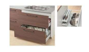
シンク用フロアキャビネット/2段引き出し