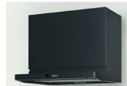
スーパークリーンフード(LED)(フード色前幕板)ブラック