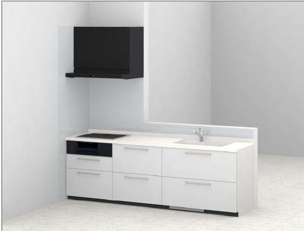
画像はイメージです。商品に床などの写り込みがあります。