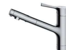
マイクロソフトシャワー水栓(ハンドシャワー式)