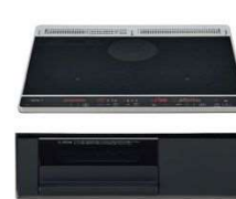
2口IH+ラジエントヒーターP:ブラック