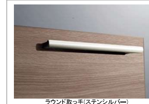
ラウンド取っ手(ステンシルパー)