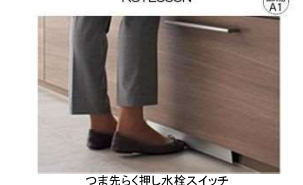
つま先く押し水栓スイッチ