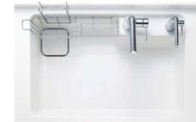
すべり台シンク(人工大理石)/ホワイト